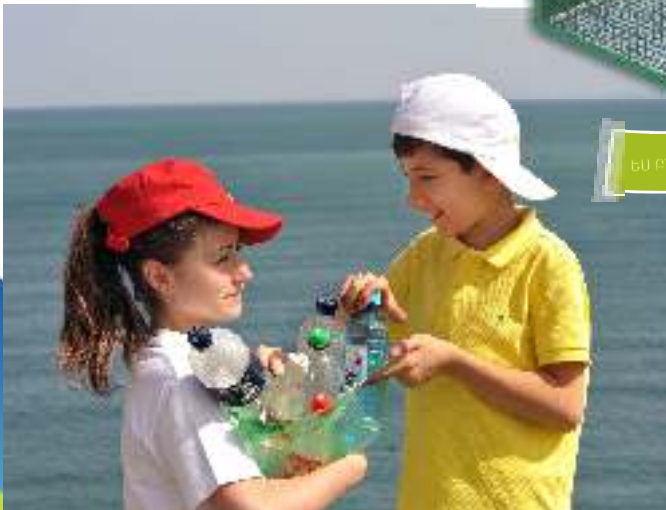
ԵՄ ԲՆՈՒԹՅԱՆ ԲԱՐՔԱՄԱՆ ԵՄ